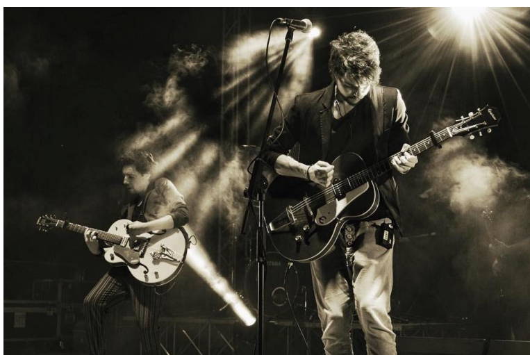
Luca e Diego Fainello in arte Sonohra

Luca e Diego Fainello, in arte Sonohra , sono due musicisti e cantautori di Verona arrivati al successo dopo aver vinto il Festival di Sanremo nel 2008 con il brano “L'amore”. Da subito hanno intrapreso una carriera internazionale pubblicando il loro album d'esordio in America Latina e Giappone, ottenendo grandi consensi. Dal 2008 ad oggi hanno pubblicato 5 album di inediti, 2 live e un Ep, intraprendendo la strada anche di produttori artistici.